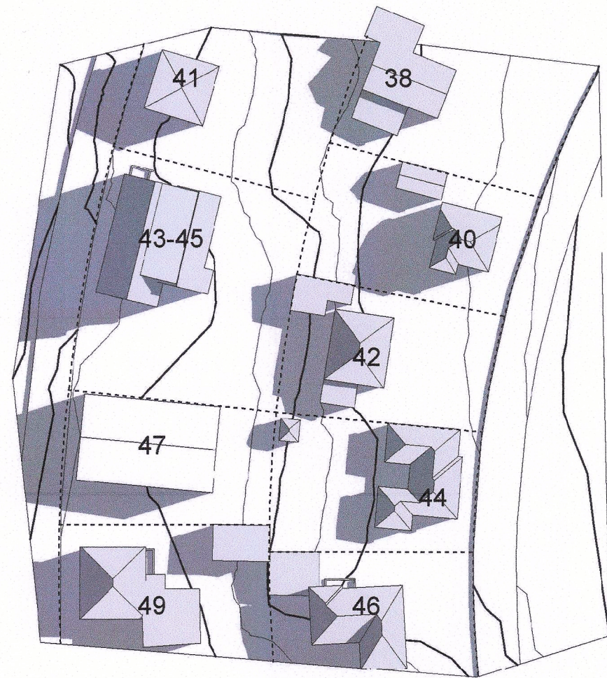
Sumarsólstöður - 21. júní - kl 07.00 - Fyrir breytingu