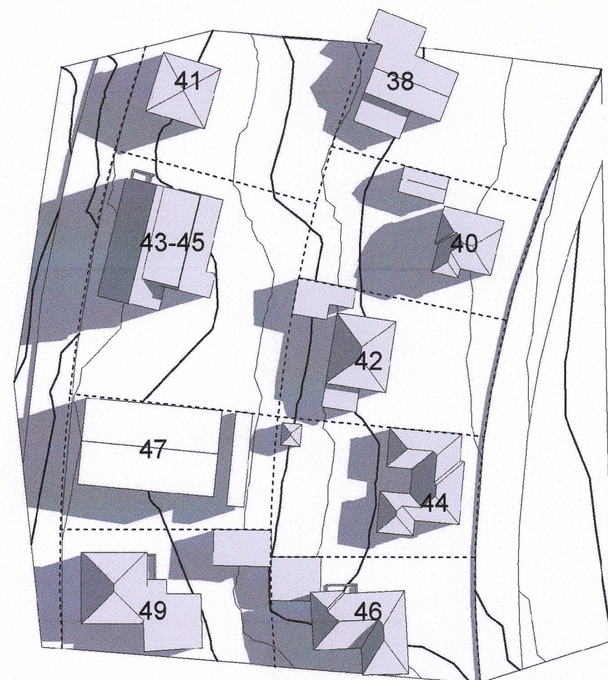
Sumarsólstöður - 21. júní - kl 07.00 - Eftir breytingu