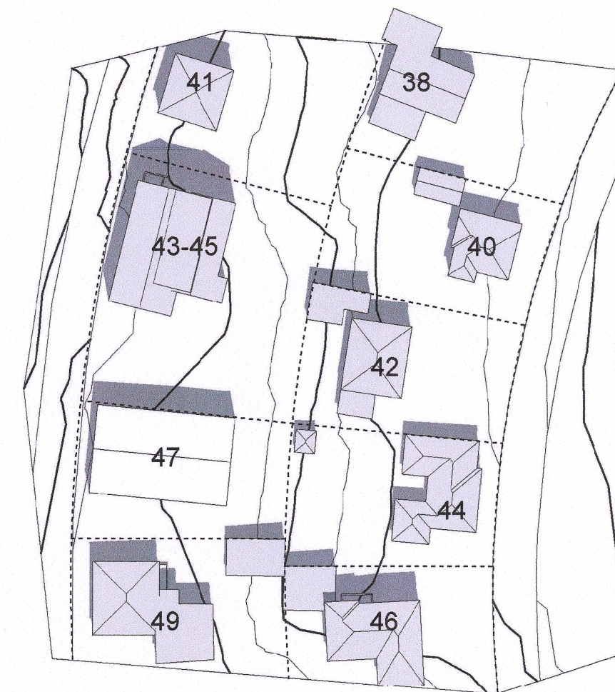
Sumarsólstöður - 21. júní - kl 13.00 - Fyrir breytingu