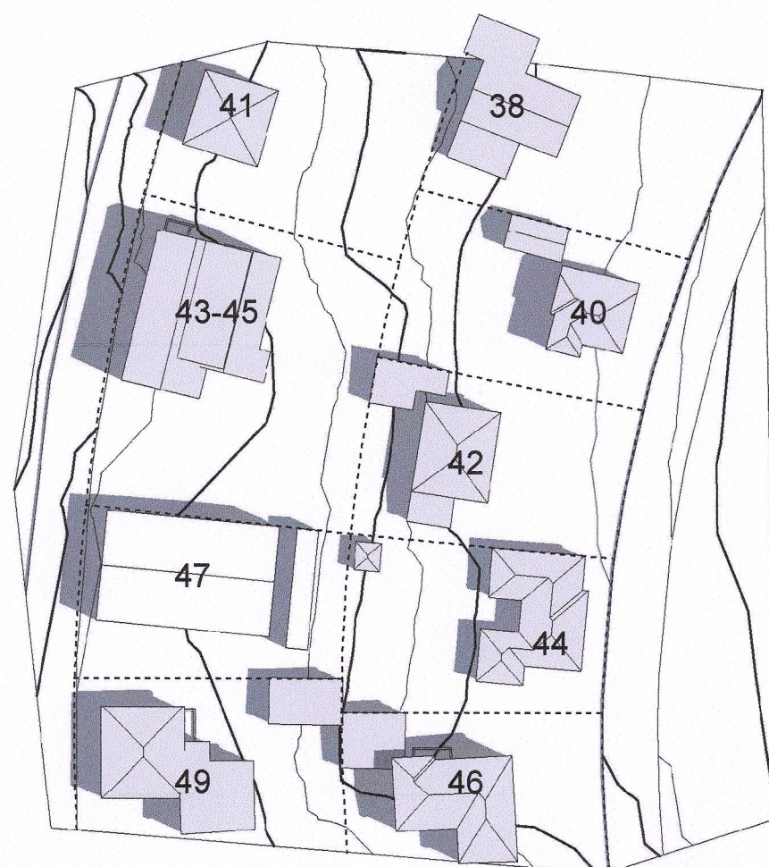
Sumarsólstöður - 21. júní - kl 10.00 - Eftir breytingu