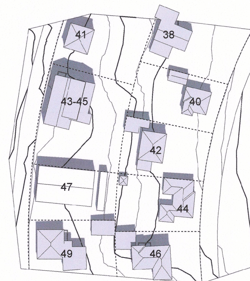
Sumarsólstöður - 21. júní - kl 13.00 - Eftir breytingu