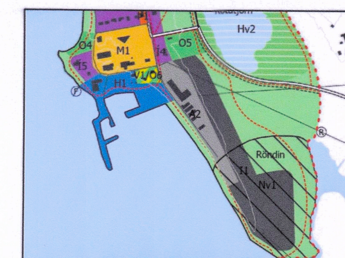
HLUTI AÐALSKIPULAGS NORÐURÞINGS 2010-2030 KÓPASKER

Fyrir utan breytingar þessar gildir áfram greinargerð deiliskipulags sem öðlaðist gildi 02.04 2020 m.s.br.