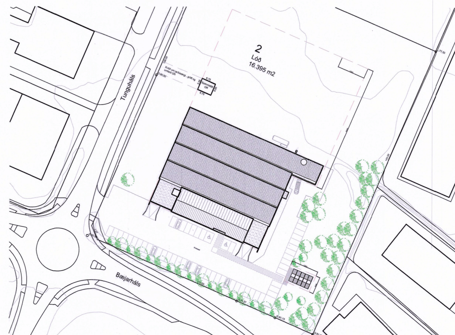
Skýringarmynd - afstöðumynd

Að öðru leiti gilda núgildandi skilmálar áfram.