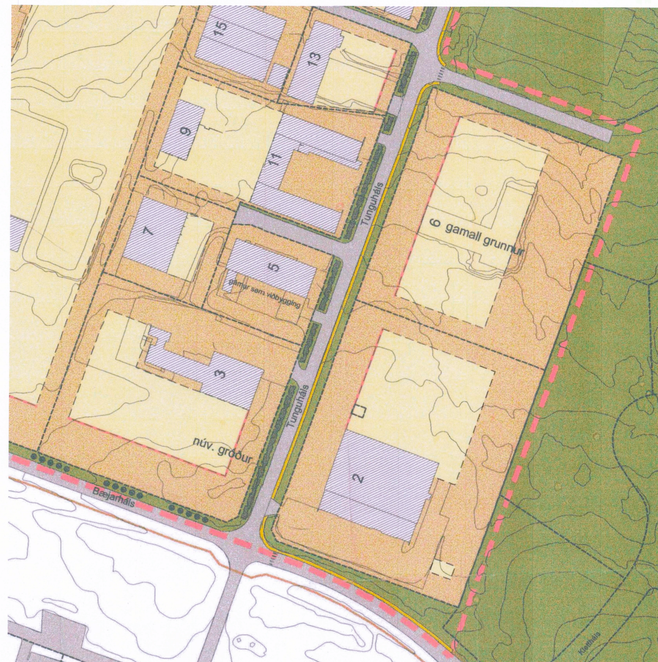
TILLAGA AÐ BREYTTU DEILISKIPULAGI mkv. 1:2000

Í gildi eru skilmálar fyrir Deiliskipulag 26_09_2000 Hálsahverfi.