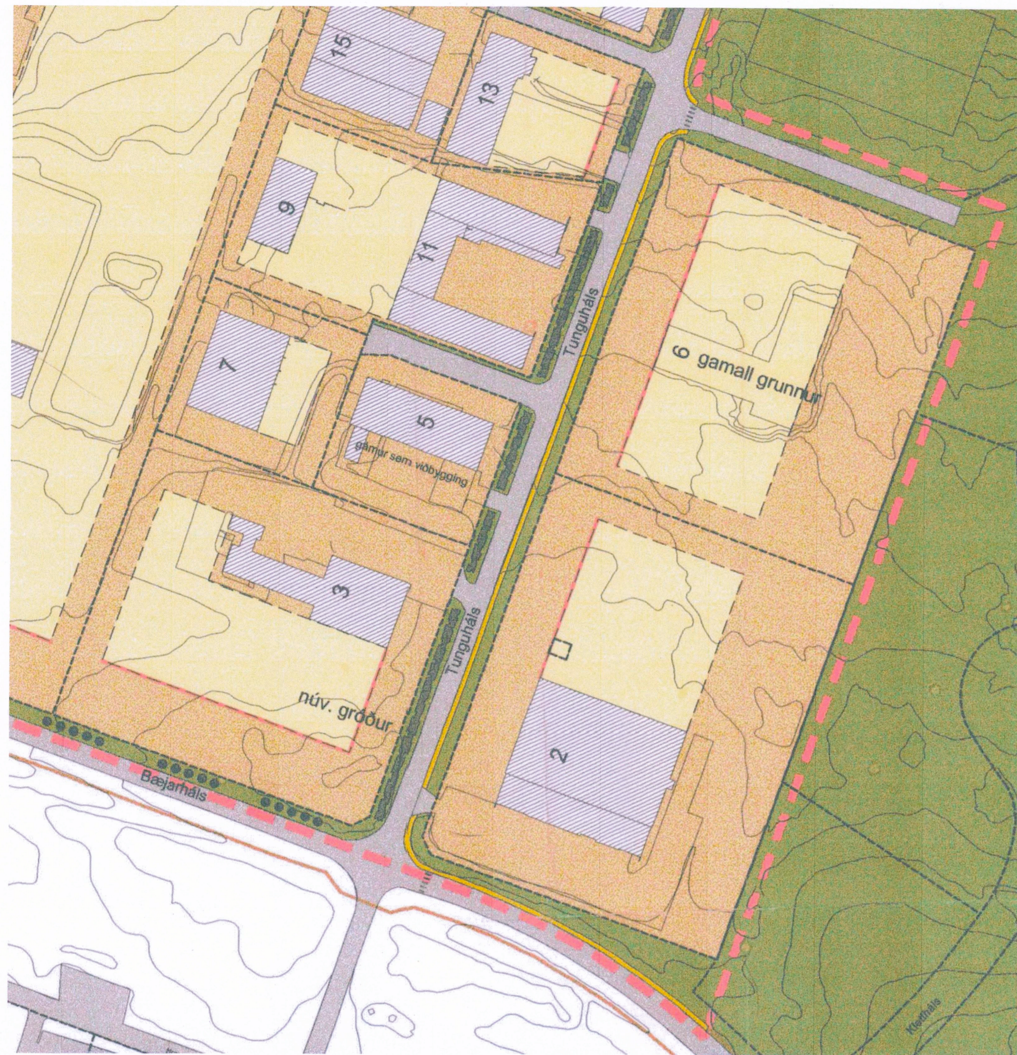
HLUTI GILDANDI DEILISKIPULAGS - HÁLSAHVERFI 26_09_2000 Samþykkt í Skipulagsnefnd þann 15. september 2000 og borgarráði þann 26. september 2000 mkv. 1:2000