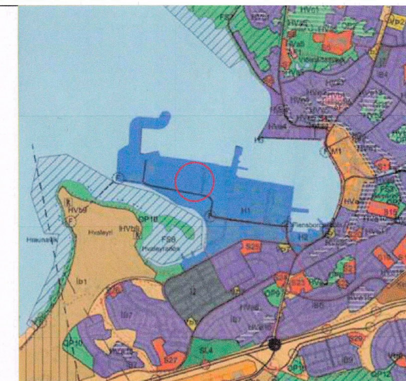
YFIRLIT - HLUTI AÐALSKIPULAGS HAFNARFJARÐAR 2013 - 2025