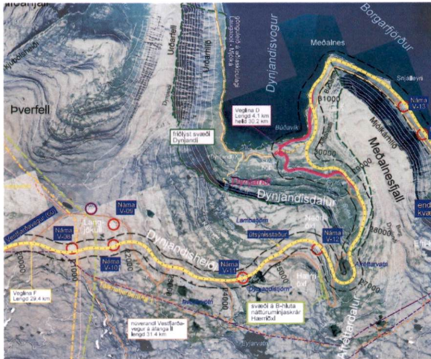
Mynd 4-1 Myndin sýnir tvo kosti sem voru til skoðunar við skipulagsgerðina, svokallaðar D og F leiðir upp úr Dynjandisvögi, ásamt efnistökusvæðum.