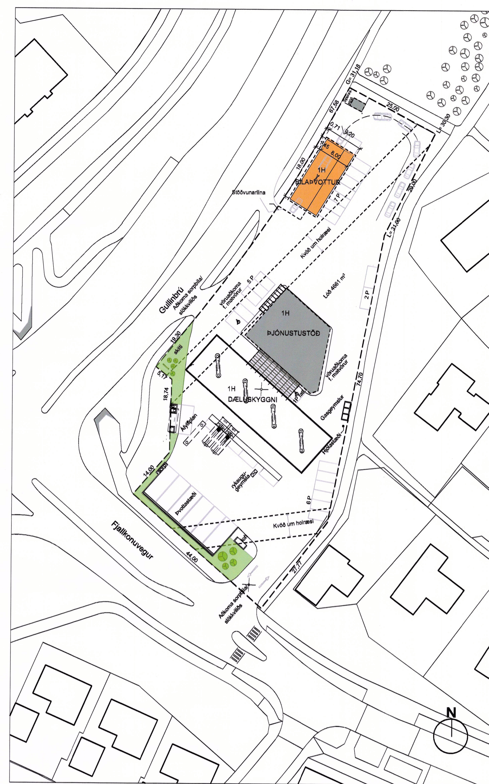
Skýringaruppdráttur mkv. 1:500

Breytingar eftir auglýsingu (29.08.2024): Heimlög vatnsveitu liggur þar sem fyrirhugað er að staðsetja byggingarreit fyrir þvottastöð. Óski húseigandi eftir breytingu eða færslu heimlagnar vegna breytinga á skipulagi húss eða lóðar, þar hann allan kostnað af þeirri breytingu eða færslu."